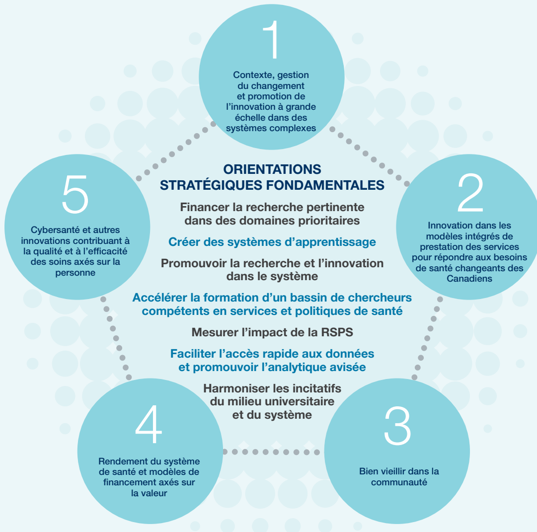
Figure B. Priorités reformulées de la recherche sur les services et les politiques de santé et orientations stratégiques fondamentales

Une alliance de recherche sur les services et les politiques de santé au Canada favoriseront une coordination, une collaboration et un investissement stratégique accrus afin d'optimiser les retombées et de renforcer le milieu canadien de recherche sur les services et les politiques de santé.